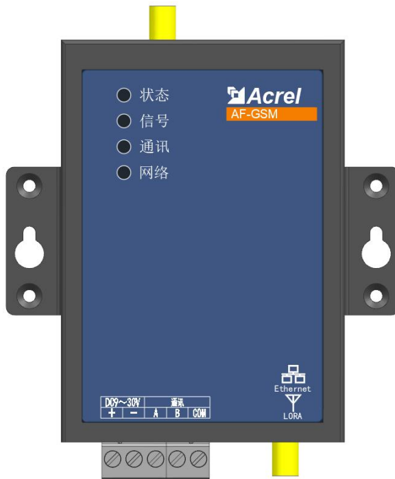
图 1 AF-GSM300/400

本产品提供标准 RS485 数据接口，可以方便的连接 RTU、PLC、工控机等设备，仅需一次性完成初始化配置，就可以完成对 MODBUS 设备的数据采集，并且与安科瑞服务器进行通讯，设备外形如图 1 所示。